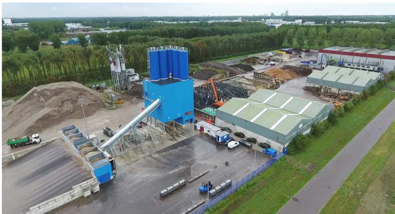
Duurzame betoncentrale Cirwinn

De reden dat we toch kiezen voor deze ketenanalyse is dat Reimert als aandeelhouder van Cirwinn (voorheen Recyclingmaatschappij Vijfhoek Flevoland B.V.) een initiatief is gestart om duurzaam beton te produceren: beton met betongranulaat als grindvervanger en beton met plantenvezels. Dit betekent niet alleen dat er CO 2 wordt bespaard op regulier beton, maar ook dat reststromen duurzaam kunnen worden verwerkt. Met deze ketenanalyse kunnen we de resultaten nauwkeurig monitoren en onze bijdrage aan de reductie van onze eigen CO 2 -footprint en die van Almere in kaart brengen. Hierbij sluiten we eveneens aan bij de doelstellingen van de gemeente Almere, namelijk het reduceren van de CO 2 -footprint van Almere en het faciliteren van nieuwe duurzame energiebronnen.